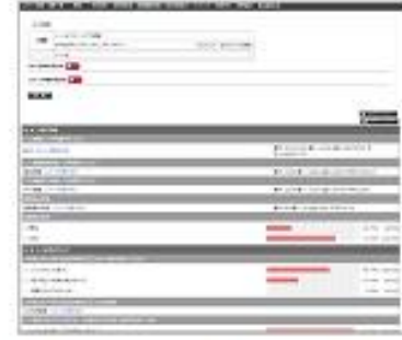
グラフによる設置率の確認が可能