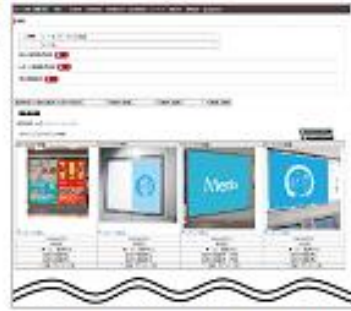
画像にて状況確認が可能